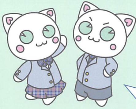
しろにゃー さとにゃー 創立 30 周年記念キャラクター (生徒作品)