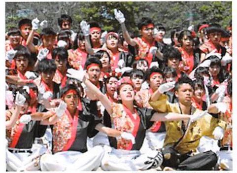
運動会 (赤組応援団)