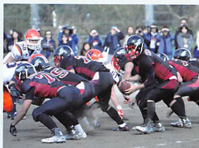
アメリカンフットボール部

コミッククリエイティブ・茶道・演劇・メディア研究 美術・囲碁将棋・吹奏楽・軽音楽・競技かるた