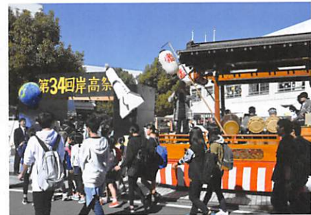
岸高祭（地域のお囃子の方々と共に）