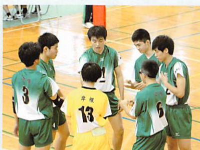
バレーボール部（男子）