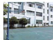
外バスケットコート