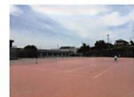
全天候テニスコート