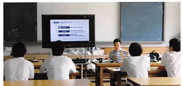
大学からの出張講義