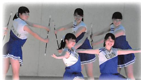
バトントワリング部