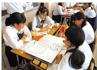
まなボードを使った授業（国語）