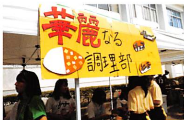
調理部のカレーとマドレーヌは毎年大行列

創立以来、港北生の自発性や自主性を支えてきたのが生徒会本部です。体育祭、球技大会、思港祭、三送会など、様々な学校行事の企画・運営にかかわっています。また、自分たちの学校生活が充実したものになるよう、生徒の意見を集約して学校へ要望を出すことも毎年行っています。