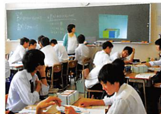
「数学B」(2年) 映像や教具を用いた授業