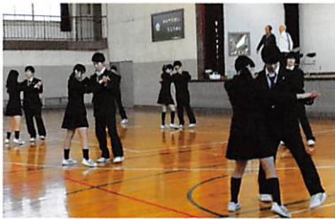
授業風景（社交ダンス）