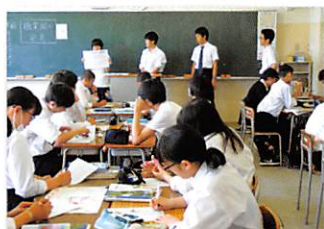
「家庭総合」(1年) 調べ学習と発表授業