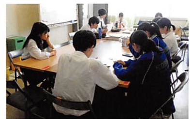
生徒会役員会（ランチミーティング）