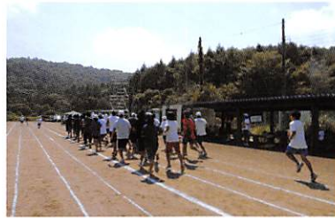
部活動合宿（陸上競技部）