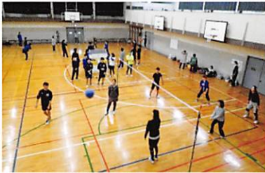
球技大会（バレーボール）

期末試験 選択科目説明会（1・2年） 球技大会 終業式 夏季休業・夏期講習・補習