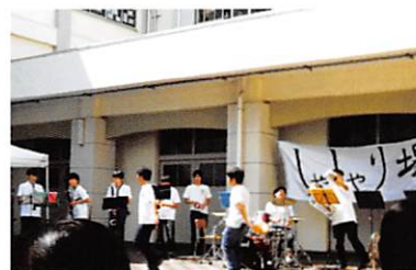
しゃしゃりば（中庭でのステージ発表）