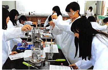
授業風景（化学実験）