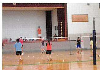
体育館 (バドミントン部)