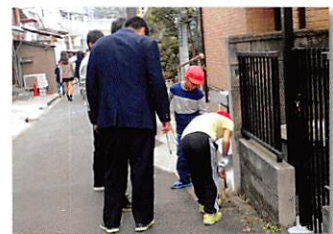
地域貢献デー（小学生と清掃活動）