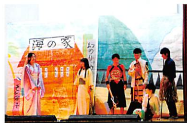
3年生のステージ発表

毎年9月に文化祭実行委員会の企画・運営の下、開催されています。優れた出し物を行った団体に贈られる「港北大賞」をめざし、クラス、部活動などが多彩な企画で競います。3年生のクラスによるステージ発表はレベルが高く、港北高校の伝統になっています。