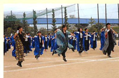
「応援合戦」（平成29年度青組優勝）