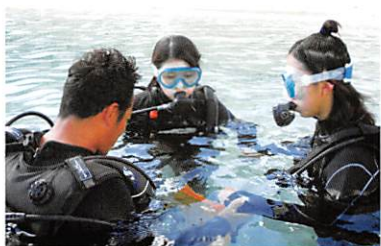
修学旅行（2年・沖縄）