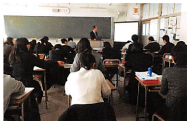
職業人講話（1年未来地図）