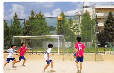
球技大会（サッカー）