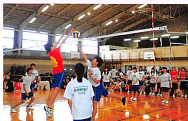
球技大会（バレーボール）

年に2回、1・3学期の終わりに球技大会実行委員会主催で球技大会が行われています。サッカー、バレーボール、バスケットボールの3種目で勝敗を競います。クラス対抗で、各種目とも男子チームと女子チームの合計得点での勝負となり、応援にも力が入ります。各部活動の生徒が審判をします。