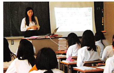
分野別大学専門学校説明会（2年未来地図）