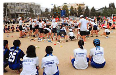
「玉入れ」（小学生との交流）